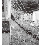
(カーテン設置当初)