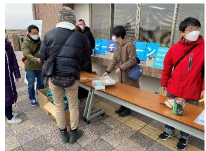
深沼ビーチクリーン