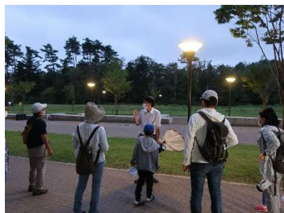
虫の声を楽しむ会